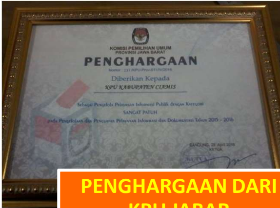
PENGHARGAAN DARI KPU JABAR