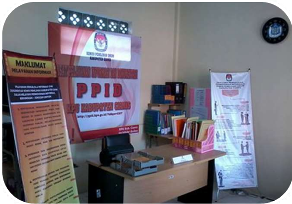
Ruangan PPID KPU CIAMIS