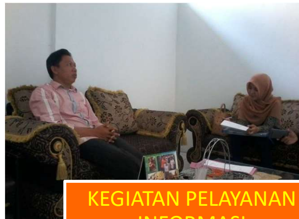
KEGIATAN PELAYANAN INFORMASI