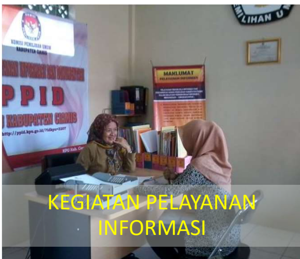
KEGIATAN PELAYANAN INFORMASI