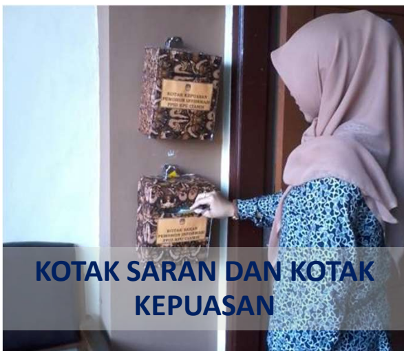
KOTAK SARAN DAN KOTAK KEPUASAN