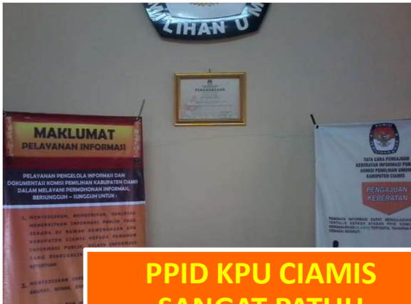
PPID KPU CIAMIS SANGAT PATUH