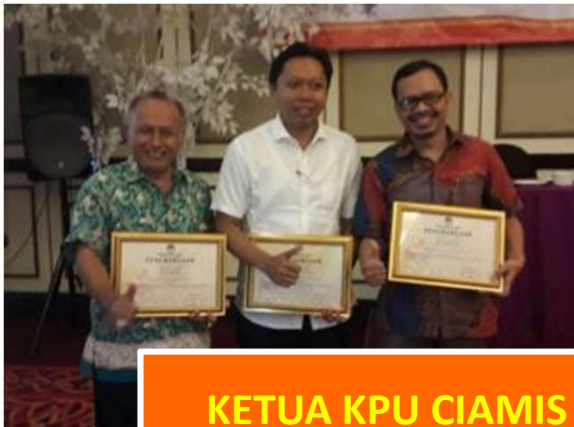
KETUA KPU CIAMIS