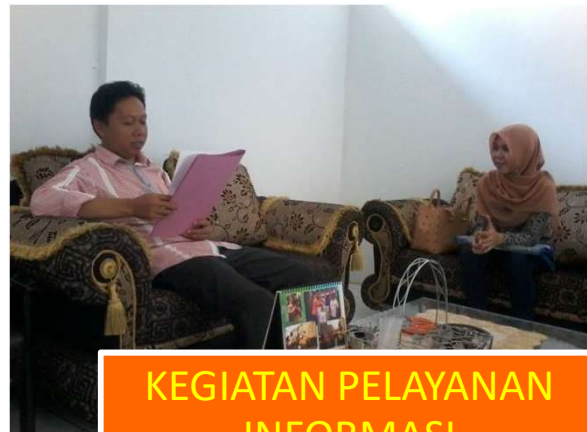
KEGIATAN PELAYANAN INFORMASI