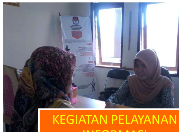
KEGIATAN PELAYANAN INFORMASI