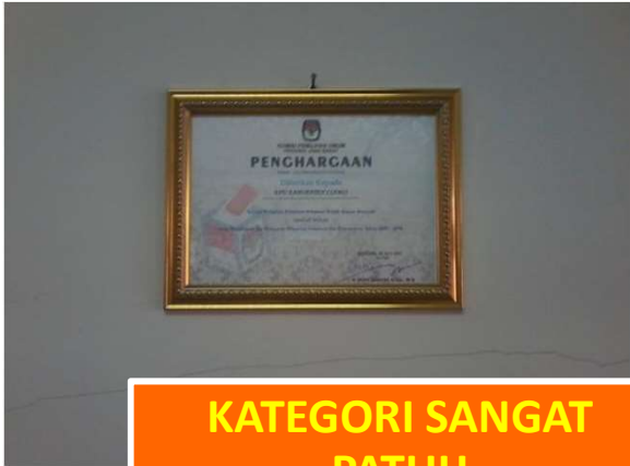
KATEGORI SANGAT PATUH