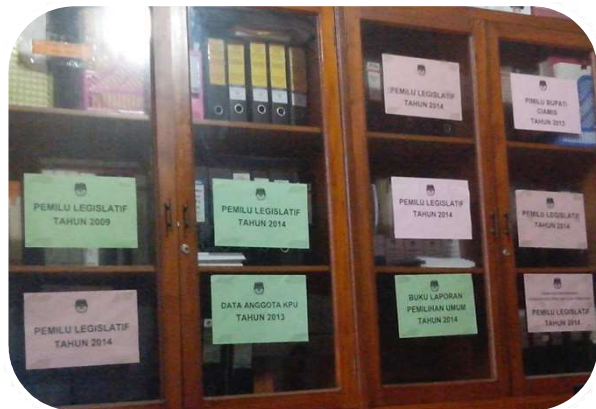
Lemari Penyimpanan Arsip